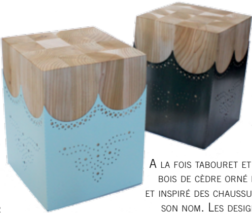
DANDY STUDIO BAAG A LA FOIS TABOURET ET TABLE BASSE, CE CUBE EN BOIS DE CÈDRE ORNÉ DE MÉTAL COUPÉ AU LASER ET INSPIRÉ DES CHAUSSURES DE DANDY PORTE BIEN SON NOM. LES DESIGNERS CAROLINE BAUER ET PIER FRANCESCO GALUPPINI DU STUDIO BAAG ONT JOUÉ SUR LE CONTRASTE MASCULIN/FÉMININ POUR PRODUIRE UNE PIÈCE LUDIQUE, PARFAITEMENT ÉQUILIBRÉE ET QUI TROUVE SA PLACE PARTOUT. WWW.STUDIOBAAG.COM