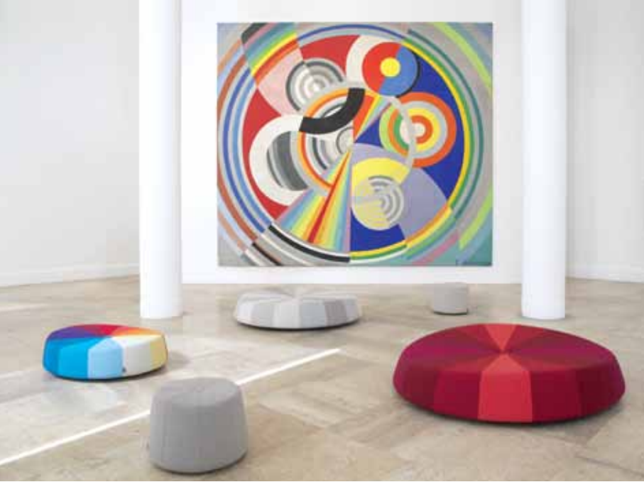
WINDMILLS CONSTANCE GUISSET CONÇUE PAR CONSTANCE GUISSET POUR LA CIVIDINA, WINDMILLS EST UNE COLLECTION COMPOSÉE DE TROIS POUFS DE TAILLES DIFFÉRENTES. INSPIRÉ DES CERCLES DE RECHERCHE CHROMATIQUE, LE PREMIER MODÈLE A ÉTÉ RÉALISÉ À L'INVITATION DE KVADRAT POUR L'EXPOSITION COLLECTIVE HALLINGDAL 65 EN 2012. LA GAMME A ENSUITE ÉTÉ EXPOSÉE AU MUSÉE D'ART MODERNE DE LA VILLE DE PARIS DU 13 MAI AU 8 JUIN 2014 DANS LE CADRE DU FESTIVAL D'DAYS. WWW.LACIVIDINA.COM WWW.CONSTANCEGUISSET.COM