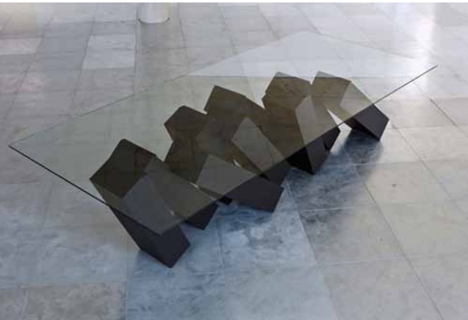
MEGALITH DUFFY LONDON INSPIRÉE PAR LE ROMAN DE SCIENCE-FICTION D'ARTHUR C. CLARKE, THE SENTINEL, UN LIVRE ADAPTÉ AU CINÉMA PAR STANLEY KUBRICK DANS SON FILM CULTE "2001: A SPACE ODYSSEY", CETTE TABLE EST COMPOSÉE D'UN PLATEAU EN VERRE QUI SEMBLE MIRACULEUSEMENT SOUTENU PAR DES MONOLITHES PRÊTS À S'EFFONDRE. UNE MAGISTRALE LEÇON D'ÉQUILIBRE. WWW.DUFFYLONDON.COM