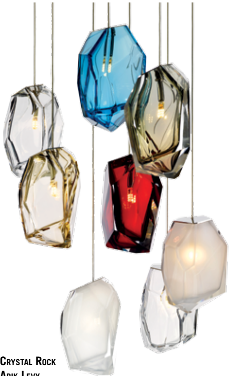
CRYSTAL ROCK ARIK LEVY POURSUIVANT SA COLLABORATION AVEC L'ÉDITEUR LASVIT, ARIK LEVY SIGNE LES SUSPENSIONS CRYSTAL ROCK LIGHTS, DES PIÈCES AUX ALLURES DE GEMMES, PRÉCIEUSES ET DÉLICATES, QUI DIFFUSENT UNE LUMIÈRE DOUCE ET APAISANTE. LASVIT OFFRE AU DESIGNER LA POSSIBILITÉ DE SCULPTER LE VERRE ET D'Y CRÉER DE MULTIPLES FACETTES. CETTE SÉRIE S'INSPIRE DES CRÉATIONS DE JOAILLIERS, FLOTTANT DANS LES AIRS ET ENVELOPPANT UN ÉCLAIRAGE À LED DISCRET ET ÉLÉGANT. WWW.LASVIT.COM WWW.ARIKLEVY.FR