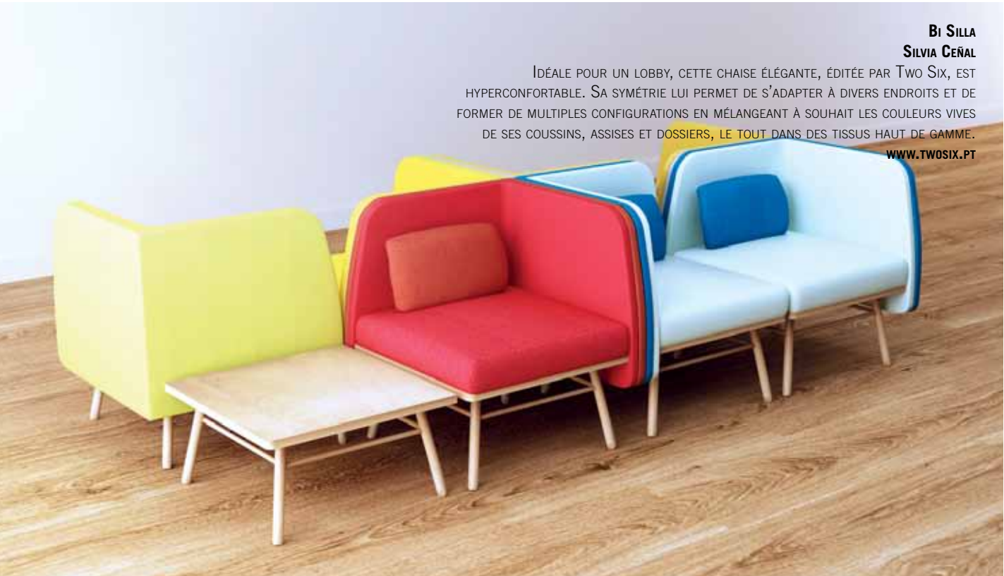
BI SILLA SILVIA CEÑAL IDÉALE POUR UN LOBBY, CETTE CHAISE ÉLÉGANTE, ÉDITÉE PAR TWO SIX, EST HYPERCONFORTABLE. SA SYMÉTRIE LUI PERMET DE S'ADAPTER À DIVERS ENDROITS ET DE FORMER DE MULTIPLES CONFIGURATIONS EN MÉLANGEANT À SOUHAIT LES COULEURS VIVES DE SES COUSSINS, ASSISES ET DOSSIERS, LE TOUT DANS DES TISSUS HAUT DE GAMME. WWW.TWOSIX.PT