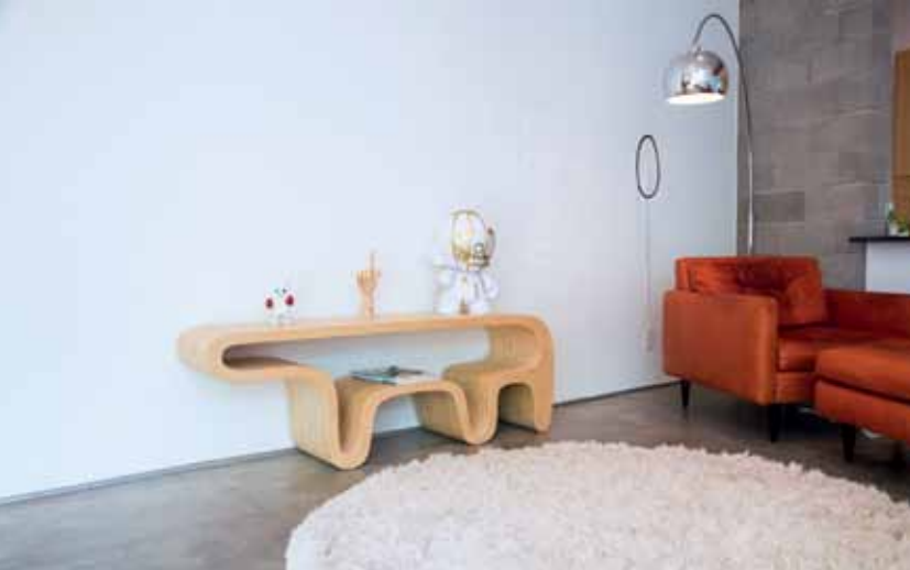
BEAR DANIEL LEWIS GARCIA À LA FOIS CHIC ET LUDIQUE, CETTE TABLE EN FORME D’OURS ÉGAYERA À COUP SÛR UNE CHAMBRE D’ENFANT, UN COIN DE JARDIN ET MÊME, POURQUOI PAS, UN LOFT. LE CONTREPLAQUÉ EN ÉRABLE A ÉTÉ MOULÉ DE FAÇON À CRÉER UN MEUBLE STRUCTURÉ SANS AUCUN JOINT À LA SILHOUETTE GRACIEUSE QUI ACCUEILLERA JOLIMENT LES OBJETS DU QUOTIDIEN. WWW.DANIELLEWISGARCIA.COM