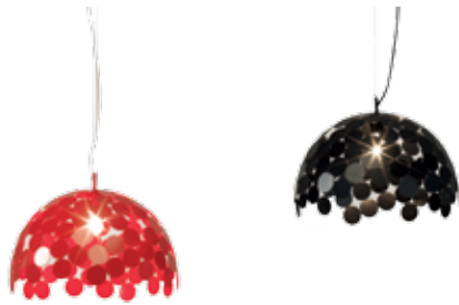
PLANET-0 DIVISUAL COMPOSÉ DE 250 DISQUES MÉTALLIQUES SOUDÉS À LA MAIN, CE LUMINAIRE JOUE CONSTAMMENT AVEC L'OMBRE ET LA LUMIÈRE. SA PARTICULARITÉ RÉSIDE DANS LE FAIT QUE, N'ÉTANT PAS CONÇU SELON UN MODÈLE DIGITAL, IL NE PEUT ÊTRE REPRODUIT À L'IDENTIQUE. CHAQUE EXEMPLAIRE EST DONC UNIQUE. WWW.DIVISUAL.IT