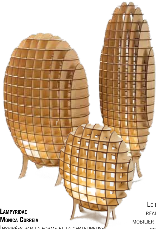
LAMPYRIDAE MONICA CORREIA INSPIRÉES PAR LA FORME ET LA CHALEUREUSE LUMIÈRE DES LUCIOLES, CES LAMPES SONT EN CONTREPLAQUÉ COUPÉ AU LASER SELON LA TECHNOLOGIE CNC (COMPUTER NUMERICAL CONTROL). CETTE COLLECTION A ÉTÉ PARTICULIÈREMENT REMARQUÉE AU SALON DESIGNJUNCTION À LONDRES EN SEPTEMBRE 2014. WWW.MONICACORREIA.COM